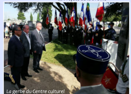
La gerbe du Centre culturel