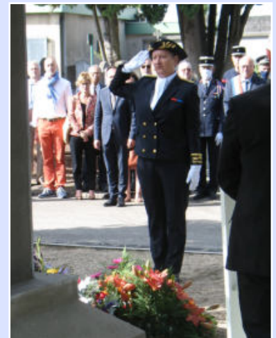
La Préfète de la Drôme