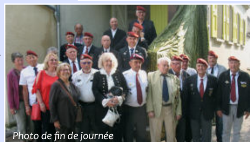
Photo de fin de journée