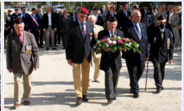
La gerbe de l'association des Troupes de marine