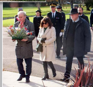
Cérémonie du parc Jouvot