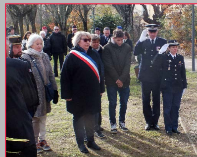
Cérémonie du parc Renée Antoine