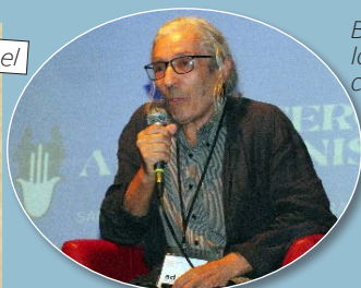
Boualem Sansal lors de notre congrès (2023)

Selon les mêmes sources, il est accusé d'"atteinte à la sûreté de l'Etat et à l'intégrité du territoire national", en raison de ses récentes déclarations à des médias proches de l'extrême droite en France. L'affaire, qui avait suscité d'abord des réactions en France, a fait l'objet d'un débat au Parlement européen, qui, selon plusieurs médias occidentaux, "s'est mobilisé pour la libération de Boualem Sansal".