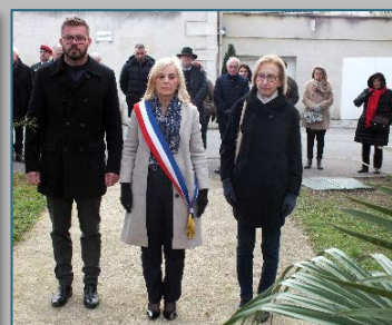
Cérémonie du square bachaga Saïd Boualam