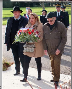
Gerbe - Centre culturel